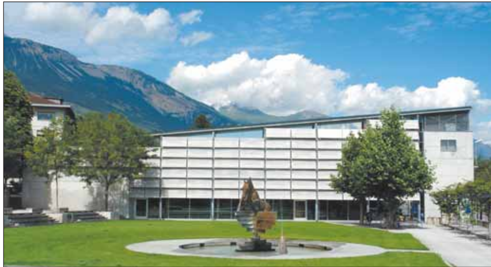
Moins de facture d'énergie à la Bibliothèque-Médiathèque de Sierre, grâce au système de contrôle désormais disponible pour les immeubles privés de la Cité du Soleil et du Haut-Plateau.