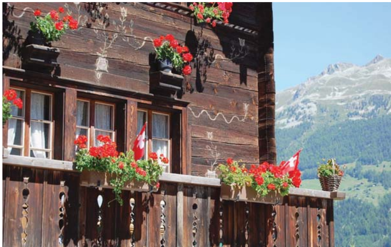
Rien ne dit que ce chalet pourra encore être revendu comme résidence secondaire, en cas de oui le 11 mars. DR

L'initiative Weber qui veut limiter à 20% le taux de résidences secondaires par commune est claire sur un point: au-delà de ce taux, toute construction de ce type sera bloquée. Mais si ce projet passe la rampe le 11 mars, cela pourrait également avoir de sérieuses conséquences sur le marché de la vente des logements déjà existants, que ce soient des résidences principales ou secondaires. Les propriétaires concernés, c'est-à-dire tous ceux qui possèdent un bien dans les nombreuses communes ayant atteint le taux fatidique, doivent le savoir: il est impossible d'assurer, à l'heure qu'il est, qu'ils pourront revendre leur bien comme résidence secondaire en cas d'acceptation de l'initiative.